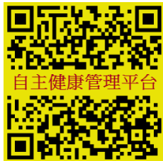
輔大校園傳染病防治調查 (自主健康管理平台)