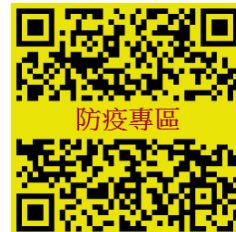
輔仁大學防疫專區